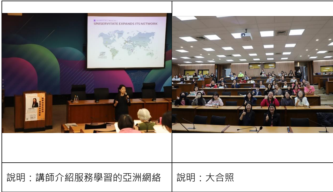
講座內容能提升對服務學習與SDGs永續發展的理解及認同